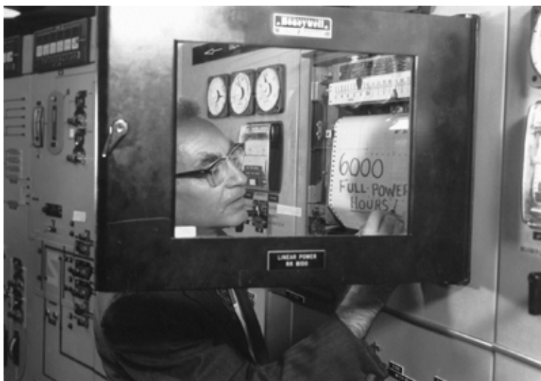
Experimente der Frühzeit: Der Nuklearpionier Alvin Weinberg notiert den Erfolg des Flüssigsalz-Reaktors in Oak Ridge im Jahr 1967.