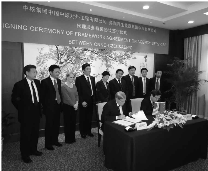
Conclusion d'un accord général sino-américain sur la réalisation de réacteurs nucléaires pour le dessalement de l'eau de mer.