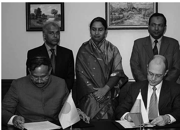
Sergueï Kirienko, directeur du groupe étatique russe Rosatom, et Yafesh Osman, ministre d'Etat pour les sciences et les techniques d'information et de communication du Bangladesh, signent un accord gouvernemental sur l'utilisation pacifique de l'énergie nucléaire.

L'organisme russe Atomstroïexport propose la réalisation de quatre réacteurs de type VVER 1200 d'une puissance globale de 4800 MW. Le projet de construction évalué à 20 milliards de dollars (22,7 milliards de francs) sera financé par Rosatom. L'an dernier, 13 entreprises avaient participé à la première phase de l'appel d'offres. Atomstroïexport a été le seul soumissionnaire à remettre l'intégralité du dossier dans les délais. →