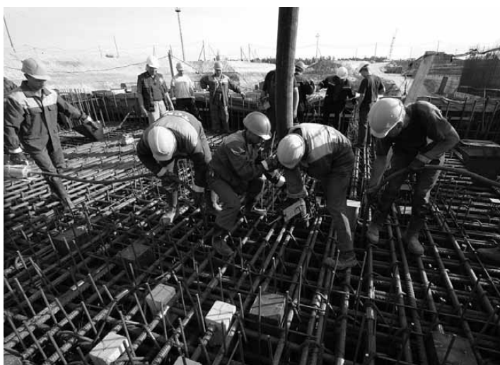
Coulée des fondations en béton du bâtiment des turbines de la tranche Leningrad II-2.

Titanstroïmontasch, une filiale du constructeur de centrales nucléaires russe Titan-2 Holding, a achevé le 16 avril 2010 les travaux de coulée du béton des fondations du bâtiment des turbines du deuxième réacteur en cours de réalisation sur le site Leningrad II. Selon Titan-2, ce sont près de 1800 m 3 de béton et plus de 700 tonnes d'acier de ferrailage qui ont été utilisés à cet effet. Le groupe qui compte plus de 4000 employés