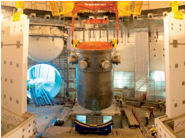
Pose de la cuve du réacteur dans le premier EPR du monde dont la mise en service est prévue en 2012 à Olkiluoto (Finlande).

en émissions de gaz à effet de serre et respectueuse du climat.