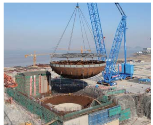
Chantier du premier réacteur à eau sous pression américain du type AP1000 mondial à Sanmen, en Chine.

Les systèmes de sûreté dits passifs constituent un développement innovant. Ils se fondent sur des lois naturelles de la physique telles que la gravité. Contrairement aux systèmes de sûreté actifs, les systèmes passifs n'ont pas besoin de pompes ou de soupapes actionnées par un moteur, et ils remplissent leur fonction