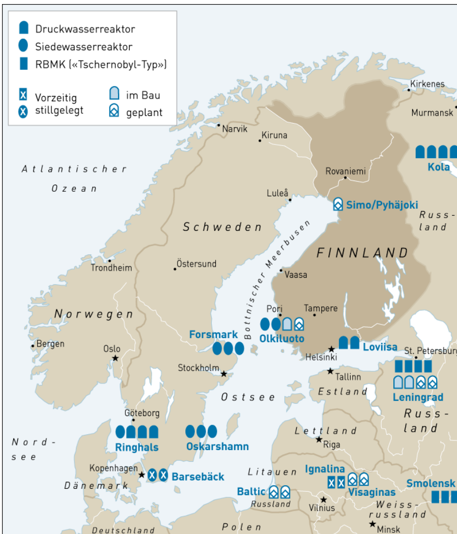
Übersichtskarte der Kernkraftwerke in Skandinavien und in den angrenzenden Gebieten.

In Olkiluoto stehen zwei Siedewasserreaktoren schwedischer Herkunft (AB Asea-Atom, heute Westinghouse Atom AB). Sie haben in den Jahren 1979 (Olkiluoto-1) und 1982 (Olkiluoto-2) den kommerziellen Betrieb aufgenommen. Eigentümerin ist die Teollisuuden Voima Oyj (TVO), die ihren Aktionären den erzeugten Strom zum Gestehungspreis abgibt. In mehreren Modernisierungsschritten wurde die Leistung der beiden Reaktoren von ursprünglich je 660 Megawatt auf heute je 860 Megawatt erhöht.