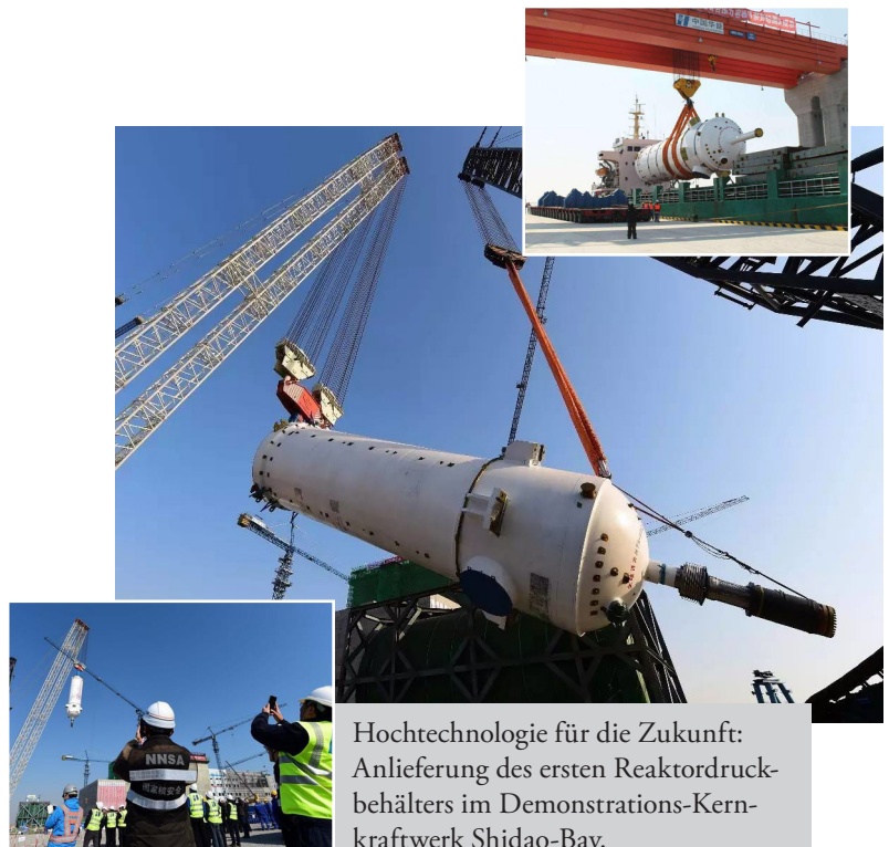
Hochtechnologie für die Zukunft: Anlieferung des ersten Reaktor-druckbehälters im Demonstrations-Kernkraftwerk Shidao-Bay.