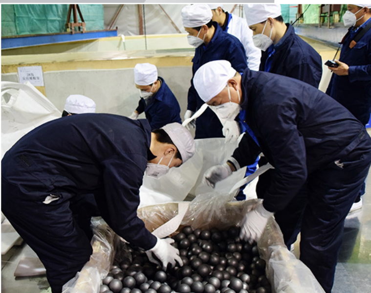
Meilenstein in China: Im Kernkraftwerk Shidao-Bay werden die ersten Graphitkugeln – hier noch ohne Urankern – angeliefert.

Der chinesische Ansatz zeichnet sich durch pragmatisches Vorgehen aus, um die Entwicklungsrisiken zu minimieren. So wurde die Austrittstemperatur des Heliums auf 750 °C beschränkt und vorerst auf eine Helium-Gasturbine verzichtet. Das heisse Helium aus dem Reaktor wird vielmehr zu einem Dampferzeuger geleitet, der wie bei herkömmlichen Druckwasserreaktoren Wasserdampf für die