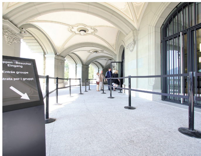
Eingang Bundesterrasse für Gäste.

www.parlament.ch parlamentsbesuche@parl.admin.ch +41 31 322 85 22 Montag bis Freitag, 08.30 - 16.00 Uhr