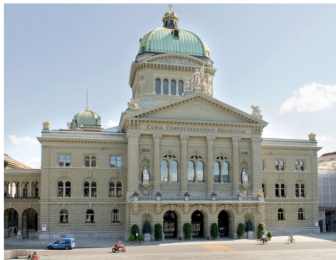
Eingang Bundesplatz für Gäste im Rollstuhl.