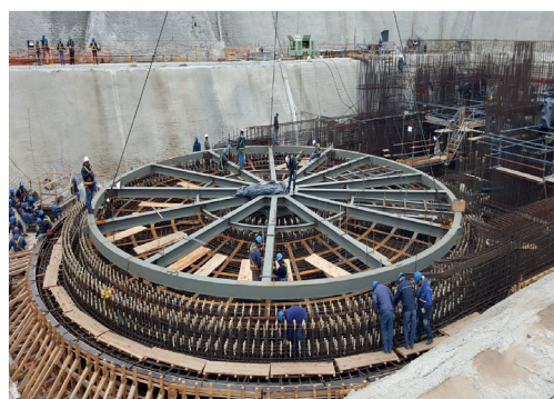
Le chantier de Carem-25, à Atucha, en Argentine. Le petit réacteur à eau sous pression sert de prototype pour développer d'autres petits réacteurs modulaires.

De plus amples informations sur les SMR et d'autres concepts de réacteurs innovants sont disponibles dans la feuille d'information «Les futurs systèmes de réacteurs», à l'adresse www.nuklearforum.ch/fr/feuilles_info .